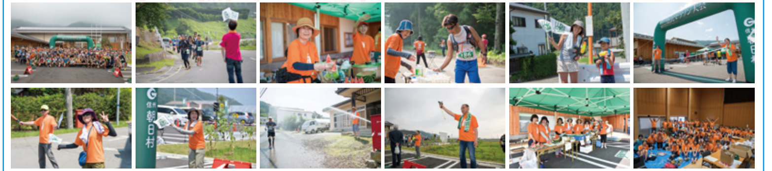
主催:朝日村観光協会 後援:朝日村 運営主管:株式会社未来図